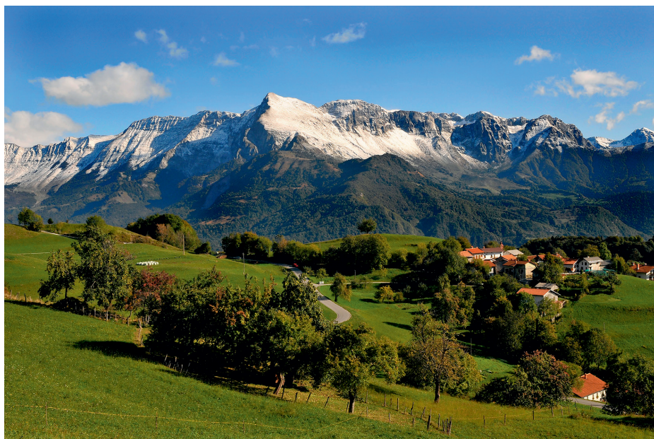
Slika 64: Perati (828 m), eden od zaselkov v Livku.